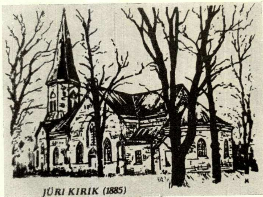
JÜRI KIRIK (1885)