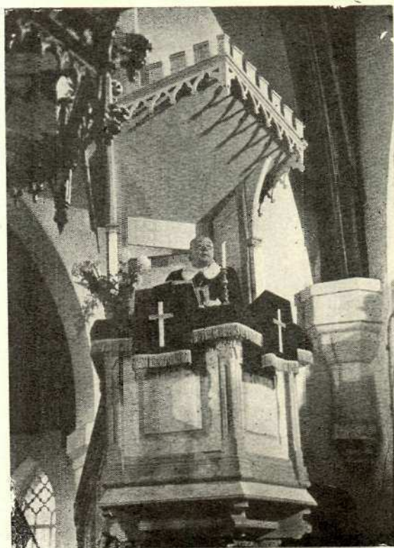
Peapiiskop Kuno Pajula jutlustamas Piibli juubelijumala-teenistusel Jüri kirikus 14. X 1989. a.